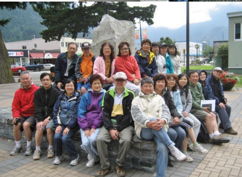
2011 約書亞團 outing